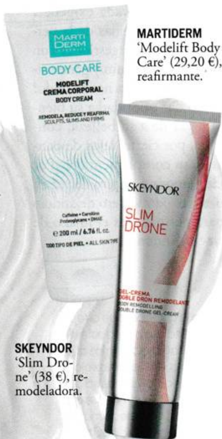
MARTIDERM 'Modelift Body Care' (29,20 €), reafirmante.